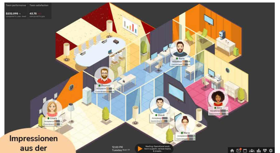
Impressionen aus der Leaderfy Simulation