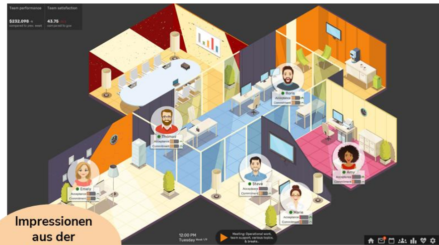
Impressionen aus der Leaderfy Simulation